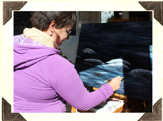
Photo couverture : P. Noël Photos couvert arrière : Festival de la chanson-M. Loiseau | Fête de la St-Jean-C. Brassard | Voilier-Rendez-vous 2017 Grande Fête des Saveurs de la Côte-Nord-C. Brassard | Happening de peinture-Courtoisie